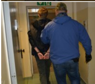
policjanci prowadzą zatrzymanego