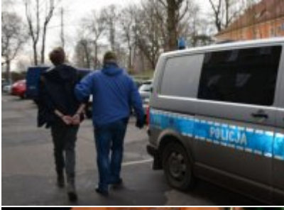
policjanci prowadzą zatrzymanego