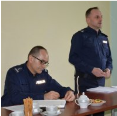
Narada roczna w Komendzie Miejskiej Policji w Opolu #6