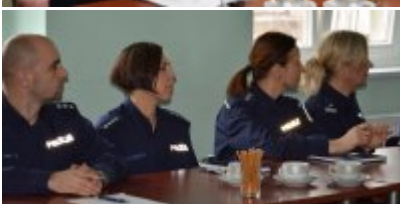
Narada roczna w Komendzie Miejskiej Policji w Opolu #5