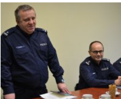
Narada roczna w Komendzie Miejskiej Policji w Opolu #4

Dużym zainteresowaniem cieszy się także Krajowa Mapa Zagrożeń Bezpieczeństwa. Na tym interaktywnym narzędziu, od września 2016 roku, odnotowaliśmy już ponad 3 500 zgłoszeń. Policjanci potwierdzili ponad 1/3 z nich, i te miejsca w sposób szczególny są pod nadzorem policyjnych patroli.