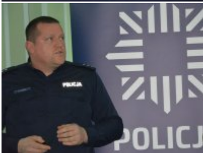
Narada roczna w Komendzie Miejskiej Policji w Opolu #1