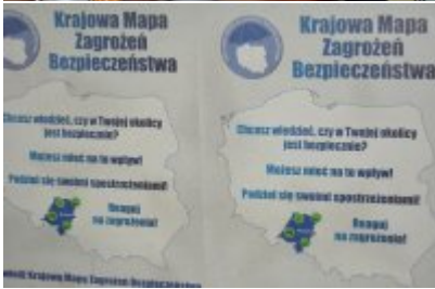
Narada roczna w Komendzie Miejskiej Policji w Opolu #3