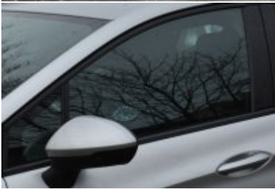
radiowóz dla policjantów #7