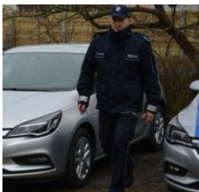
radiowóz dla policjantów #1

Warto wspomnieć, że lokalne samorzady wsparły także finansowo remont pomieszczenia dyżurnego jednostki w Ozimku oraz zakup nowego sprzętu biurowego.