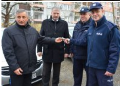
radiowóz dla policjantów #4