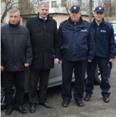
radiowóz dla policjantów #6