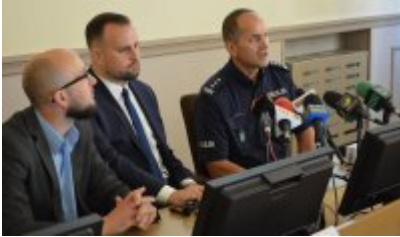
zdjęcie z konferencji #2