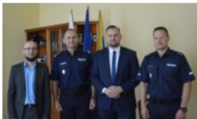
zdjęcie z konferencji #9