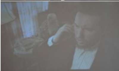
zdjęcie z konferencji #6