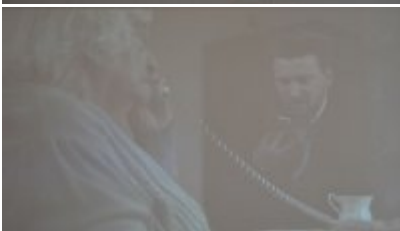
zdjęcie z konferencji #7