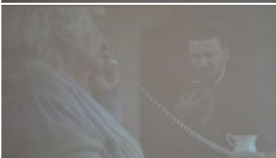
zdjęcie z konferencji #7