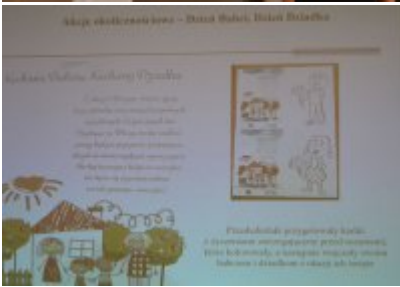
zdjęcie z konferencji #4