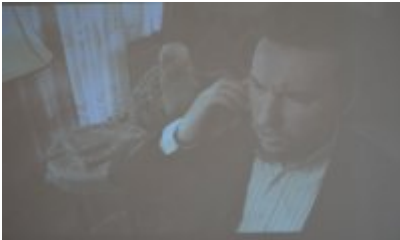
zdjęcie z konferencji #6