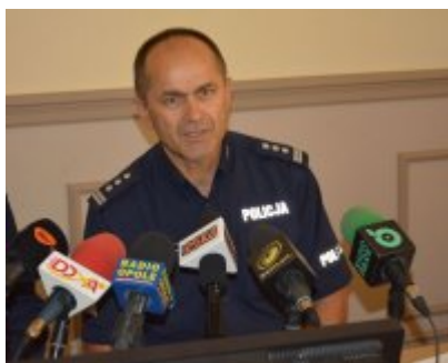
zdjęcie z konferencji #1

W 2016 roku na Opolszczyźnie miało miejsce 17 oszustw na tzw. wnuczka lub policjanta. Opolscy seniorzy stracili blisko 330 tys. złotych. W tym roku doszło do 10 takich oszustw na blisko 260 tys. złotych. Opolscy policjanci przeprowadzili 406 spotkań, w trakcie których przeszkolili około 10 tysięcy seniorów.