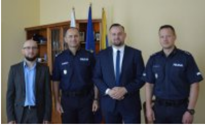
zdjęcie z konferencji #9