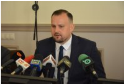
zdjęcie z konferencji #5