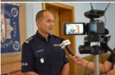
zdjęcie z konferencji #8