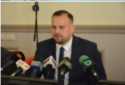
zdjęcie z konferencji #5