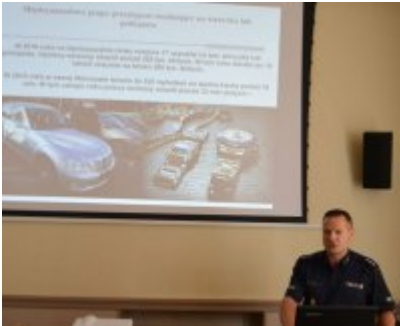
zdjęcie z konferencji #3