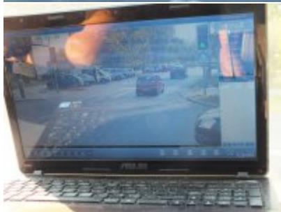
zdjęcia z akcji