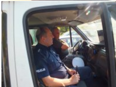
zdjęcia z akcji