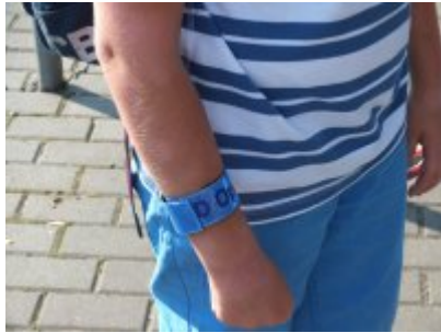
zdjęcia z akcji