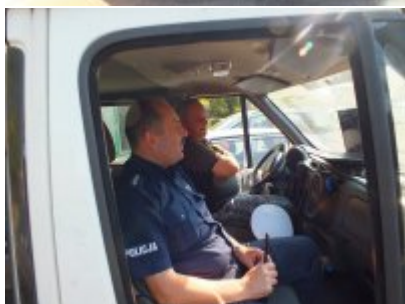
zdjęcia z akcji