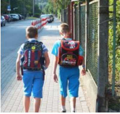
zdjęcia z akcji