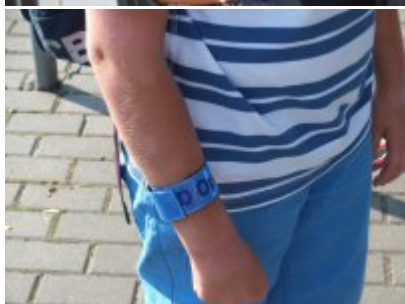
zdjęcia z akcji