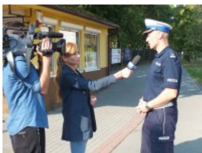
zdjęcia z akcji

Akcja „Bezpieczna droga do szkoły” adresowana jest także do wszystkich dorosłych, w szczególności do rodziców i nauczycieli, na których ciąży obowiązek edukacji dzieci.