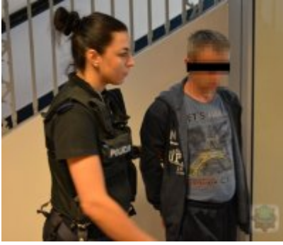
Zatrzymany w chwilę po ataku - odpowie za usiłowanie zgwałcenia