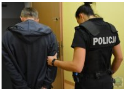
Zatrzymany w chwilę po ataku - odpowie za usiłowanie zgwałcenia

Napastnikiem okazał się 40-letni mieszkaniec województwa świętokrzyskiego. Badanie policyjnym alkomatem pokazało, że ma on w swoim organizmie blisko 2 promile alkoholu. Mężczyzna usłyszał zarzut usiłowania doprowadzenia przemocą do obcowania płciowego. 40-latek przyznał się do popełnionego przestępstwa. Grozi mu teraz kara do 12 lat więzienia.