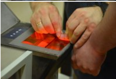
Zatrzymani za zabójstwo