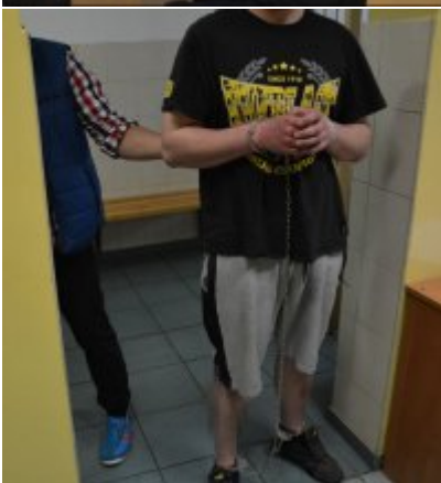
Zatrzymani za zabójstwo