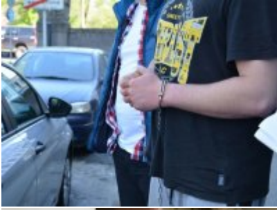
Zatrzymani za zabójstwo