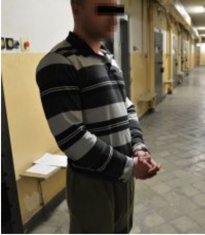
Zatrzymani za zabójstwo